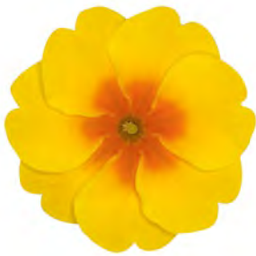
eblo® goldgelb mit Auge