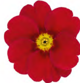
eblo ® rot Rotauge