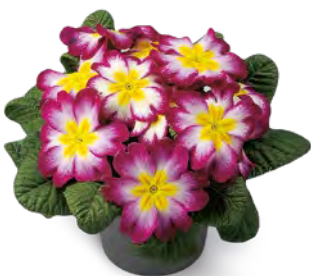
elunistar ® elcora karmin