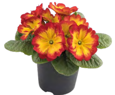
aurela elcora rot