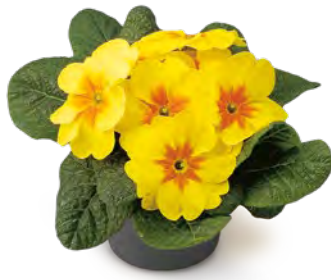
elunistar® gelb mit Auge