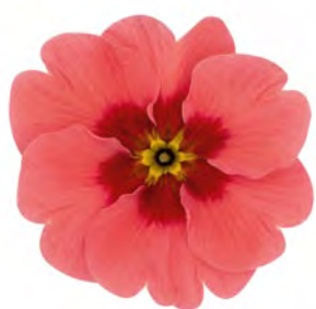
eblo ® himbeere