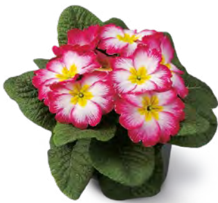
elunistar ® elcora rosa