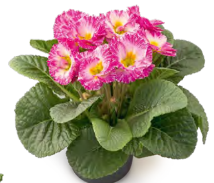
elodie elcora rosa