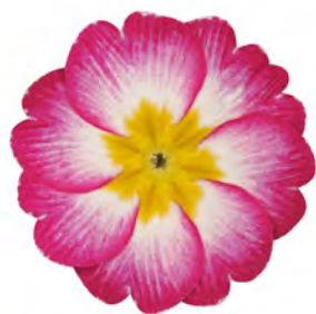
eblo® elcora rosa