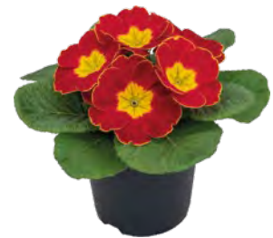
primella ® rot