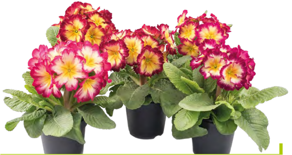
sibel ® karmin-creme Töne

Alle, die das Besondere lieben, kommen an sibel ® nicht vorbei. Der Polyantha-Typ mit seinen großen Blüten, die als Blütenkrone auf kräftigen Stielen über dem Laub stehen, eignet sich für einen starken Auftritt. Doch auch mit den längeren Blütenstielen wirkt die Pflanze insgesamt kompakt und wie aus einem Guss. Ob leuchtend gelb wie die Frühlingssonne, zweifarbig in Scharlach oder elegant in Weiß und Lime – sibel ® macht immer eine gute Figur.