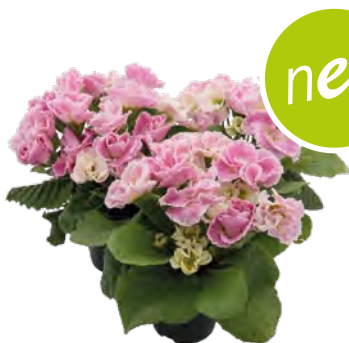
eblo ® die rosa-hell