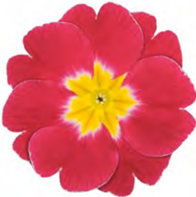
eblo ® rosa