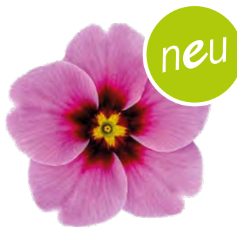
eblo ® lavendel