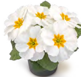
fruelo® weiß mit Auge