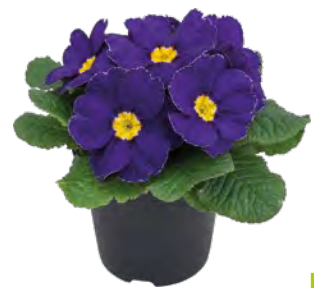
primella ® blau