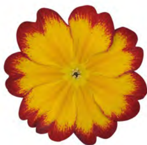
eblo® elcora rot