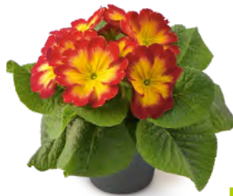
fruelo® elcora rot