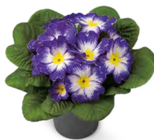
elunistar ® elcora blau