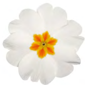
eblo ® weiß mit Auge