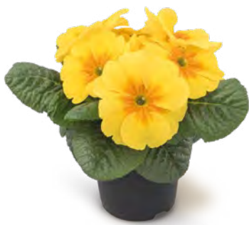
gelaya gelb mit Auge