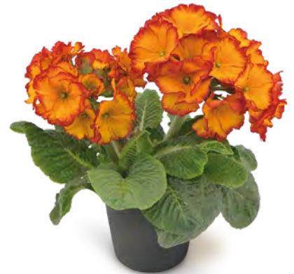
sibel ® scharlach