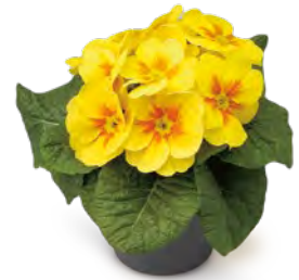
fruelo® gelb mit Auge