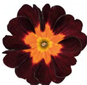
eblo ® bloody mary