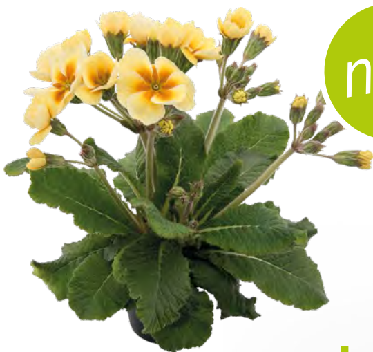
stella® creme mit Auge