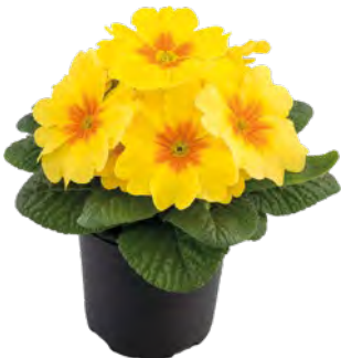
aurela gelb mit Auge