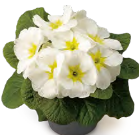
elunistar ® weiß-grün