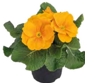
primella ® orange