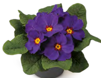
elunistar® blau Rotauge