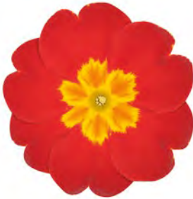
eblo ® rot