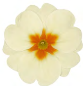
eblo ® creme mit Auge