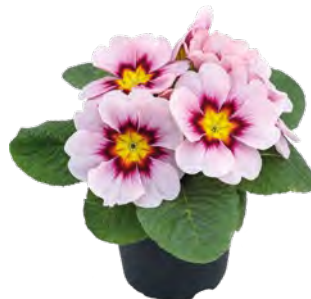
primella ® apfelblüte

Die neue primella ® Mischung sorgt für Frühlingsgefühle in der dunklen Jahreszeit. Sie bietet das gesamte Spektrum der beliebtesten Farbvarianten in einem attraktiven und harmonischen Zusammenspiel. Die Pflanzen der primella ® Serie sind nur für die Unterglaskultur geeignet und vereinigen die beliebtesten Primeleigenschaften in einer einzigen Mischung. Hierin enthalten sind Einzelfarben von Weiß über Gelb bis Blau, aber auch einige Sonderfarben. Die mittelgroßen Blüten leuchten auf kompakt wachsenden Pflanzen mit einem gleichmäßig runden Aufbau. Bei einigen Blütenfarben wird die romantische, frühlingshafte Ausstrahlung noch durch einen zarten, kontrastfarbenen Saum betont. Ein toller Mix für einen frühen Start in die Blühsaison und ein Highlight für das Angebot in der Vorfrühlingszeit.