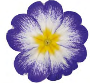
eblo® elcora blau