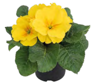
primella ® gelb mit Auge