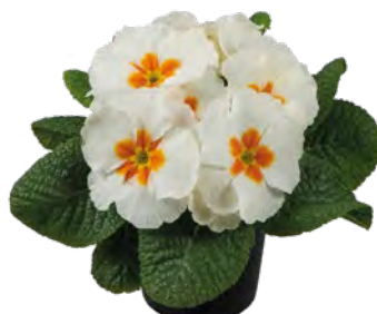
elunistar ® weiß mit Auge