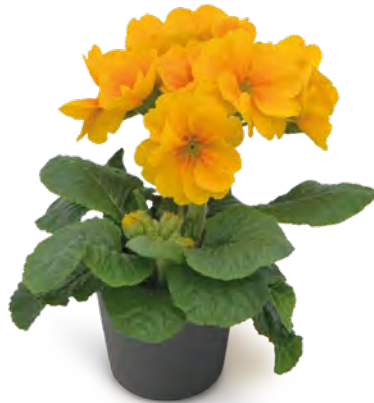
sibel ® goldgelb