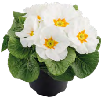
aurela weiß mit Auge