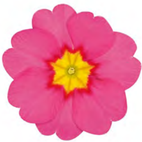
eblo® rosa Rotauge