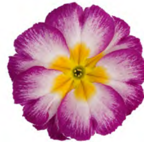
eblo® karmin creme