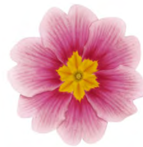
eblo ® apfelblüte