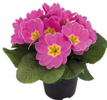
elunistar ® rosa-hell