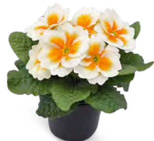
elunistar ® buttercream