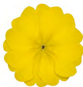
eblo ® gelb-zitrone