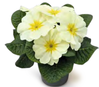
elunistar ® lime