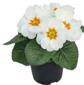
primella ® weiß mit Auge