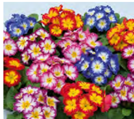
fruelo® elcora Mischung