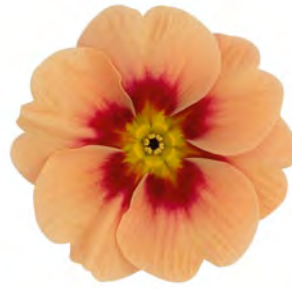
eblo® creme Rotauge