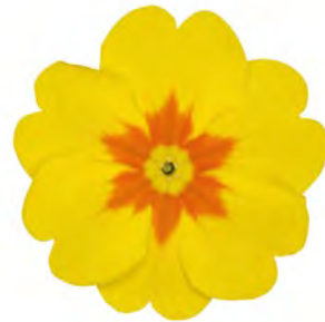
eblo ® gelb mit Auge