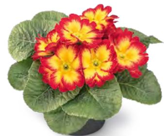
elunistar ® elcora rot