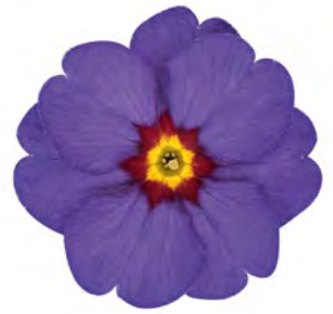
eblo® blau Rotauge