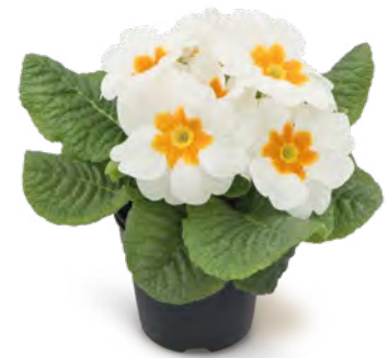
gelaya weiß mit Auge